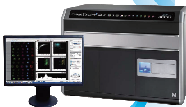
ImageStream x mark II

イメージングフローサイトメーター: ISX mk II とは、高速で細胞を流しながら、細胞の蛍光強度、並びに、細胞1つ1つの画像を習得できる装置です。フローサイトメーターのスループット性と統計解析能力、蛍光顕微鏡のイメージング機能とを融合させることで、細胞およびその集団からの情報量を飛躍的に増大させるイメージングフローサイトメーター (IFC)。この革新的技術を用いた世界で唯一のイメージングフローサイトメーター (IFC) の可能性をご紹介します。